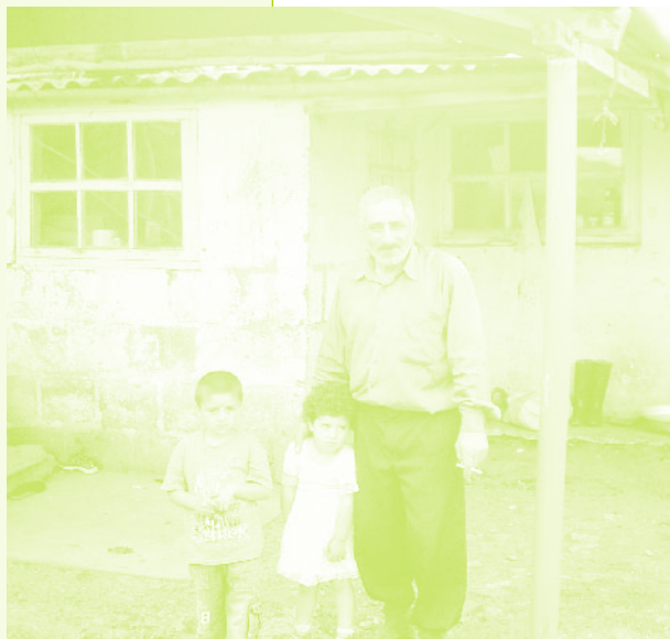
Фото 52. «Жители села Дзюнашох (Кызыл-Шафаг), Армения, 2006 г.»

прошедшие после обмена годы не смог по понятным причинам посетить прежнее село, кладбище, несмотря на то, что стороны договаривались о взаимных посещениях. И в конце концов, по словам информанта, они не думали, что все так сложится. Общий контекст армяно-азербайджанских отношений (война, неразрешенный конфликт и т.д.) также обостряют чувство потери.