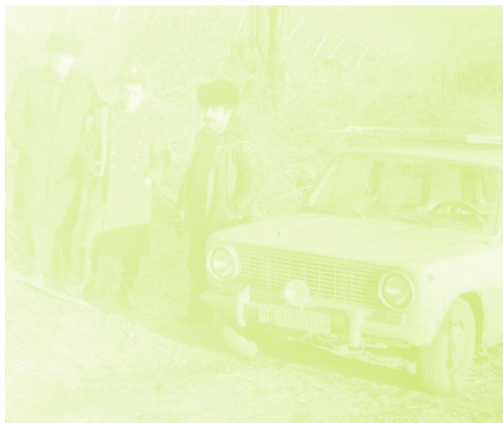
Фото 9. «К подступам села Керкендж. Солдаты не пропускают машину»