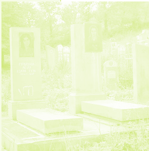
Фото 20. «Азербайджанское кладбище в селе Дзюнашох (Кызыл-Шафаг), Армения, 2006 г.»

Керкендж. Вот так и обменялись» (Мадар, около 40 лет). Таким образом, сын председателя совхоза сыграл заметную роль в свершившемся обмене.