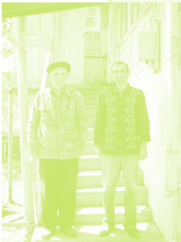
Фото 53. «Жители села Дзюнашо (Кызыл-Шафаг), Армения, 2006 г.»

Восприятие новой местности и память о Керкендже имеют интересные проявления также на индивидуальном уровне. Наши информанты уже смирились с переселением, жизнью на новом месте и т.п. Этому процессу способствовало также восприятие Армении как этнической и политической родины. Как говорит один из информантов, «теперь ты знаешь, что находишься на родной земле» . «Родную землю» надо понимать также как политическое пространство, и в этом контексте она не противопоставляет-