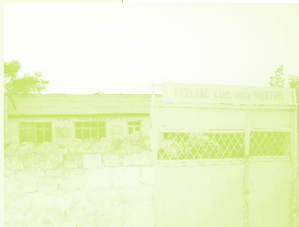
Фото 28. «Сельская школа приняла новых учеников и учителей уже в сентябре 1989 года. Село Керкендж, Азербайджан, 2006 г.»