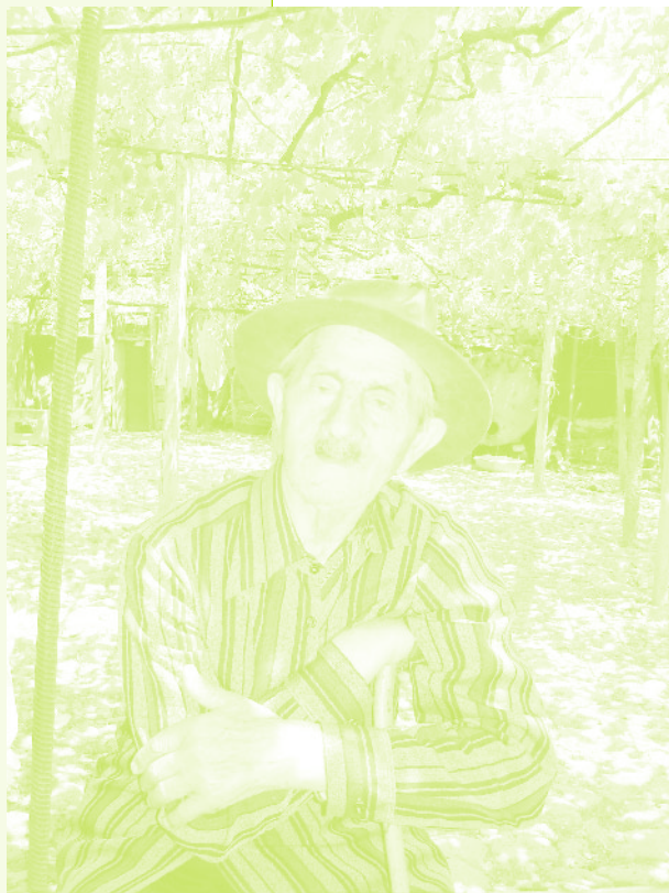
Фото 34. «Вейис-киши, 91 год, ныне успешный фермер, последние 2 месяца в Кызыл-Шафаге жил вместе с переехавшими в село керкенджцами. Село Керкендж, Азербайджан, 2006 г.»

Шемахе одного армянина избили и уже после этого все армяне уехали, никого не осталось, испугались... Но здесь армяне жили. Многие обменялись домами, а те, кто не обменялся, они продали свои дома за деньги <...> продали и уехали». В пространстве же деревни это всегда было вполне мирное сосуществование. «Ничего, ничего такого не было... Недоразумений не было. Чтобы кто-то подрался или сказал что-то. Нет, такого не было. Они бы здесь все равно не остались, разве они бы смогли остаться? Клянусь Аллахом, научили нас печь хлеб в тьяндире [специфическая