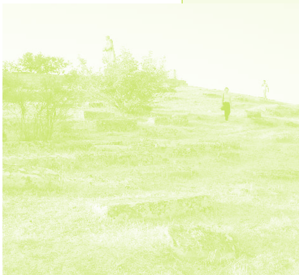
Фото 21. «Старая часть армянского кладбища на фоне памятника воинам ВОВ, село Керкендж, Азербайджан, 2006 г.»

26. На наш взгляд, приспособление старого обычая к постоянно изменяющимся условиям и ситуациям нужно рассматривать, скорее, как правило, нежели исключение. Здесь можно только согласиться с Джеймсом Скоттом, который указывает на то, что «было бы неправильно представлять обычаи как законы. Обычаи лучше понимать как действующие практические договорные отношения, которые непрерывно приспособляются к новым экологическим и социальным обстоятельствам, включая, конечно, и отношения с властью». Скотт Д. Благими намерениями государства. Почему и как провалились проекты улучшения условий человеческой жизни. М.: Университетская книга, 2005. С.60.