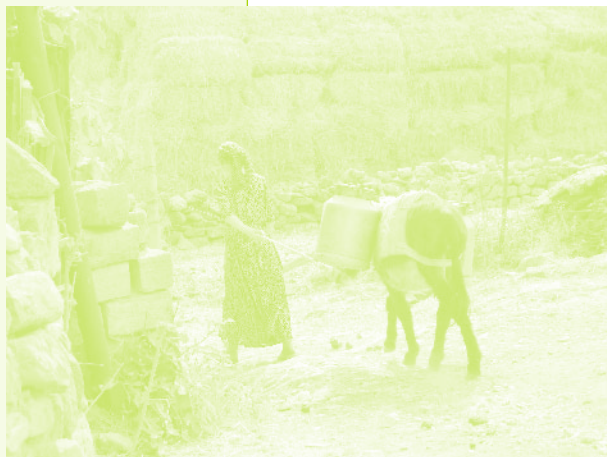
Фото 47. «Жительница села идет к источнику за водой. Село Керкендж, Азербайджан, 2006 г.»

такие росли! Два яблока – один килограмм! Двухэтажный дом, а в подвале осенью из-за яблок ногой нельзя было ступить. Вот так мы жили!». Однако, наряду с воспоминаниями об утратах в связи с исходом из родных мест, может соседствовать и смирение с судьбой. «Неправильно сейчас нам хвалить то, что имели там, все это обман. Дай бог им здоровья (аксакалам), привезли нас сюда, кое-как живем, выкручиваемся. Это как у русских говорят – существуем, э-э, существуем (по-русски). Это как и не живешь и не умираешь, т.е. как бы не идешь так прямо, а иногда падаешь, иногда поднимаешься на ноги. В общем, что еще вам рассказать. Там у меня машина была своя. <...> Сам я преподавал в училище. 18 лет проработал в училище. <...> Вообще хорошо мы там жили, отлично там было. 300 рублей! 300 рублей я получал зарплату в училище! Обстановка там, конечно, была