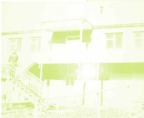
Фото 1. «Фотография Мамедакиши в собственном доме в Кызыл-Шафаге (Армянская ССР) незадолго до событий»

6. Подробнее об этом убийстве старика - азербайджанца будет рассказано ниже в разделе, посвященном самообороне кызыл-шафагцев.