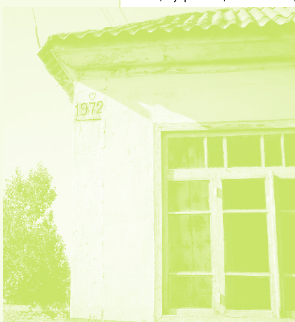
Фото 23. «Дом с надписью 1972, село Дзюнашох (Кызыл-Шафаг), Армения, 2006 г.»

В Азербайджане было намного сложнее. Преграды здесь возникли именно тогда, когда уже все было договорено между общинами и процесс начал переходить в реальную фазу. Эти преграды чинили именно власти. Вот как это происходило, согласно рассказу информанта: «В конце было так: их [азербайджанцев Кызыл-Шафага – А.А.] директор и еще три-четыре человека, директор совхоза, председатель сельсовета, их инженер, их аксакалы пришли... Нам сказали, что им не позволяют [в Шамахе], чтобы дома, село обменивали со здешними... Хотели, чтобы наши дома были проданы. Наше место хорошее, земли много. Райком не позволял, Шамахинский райисполком...» . Потом обе стороны проводили «работу», чтобы обмен осуществился. Азербайджанцы Кызыл-Шафага обратились к