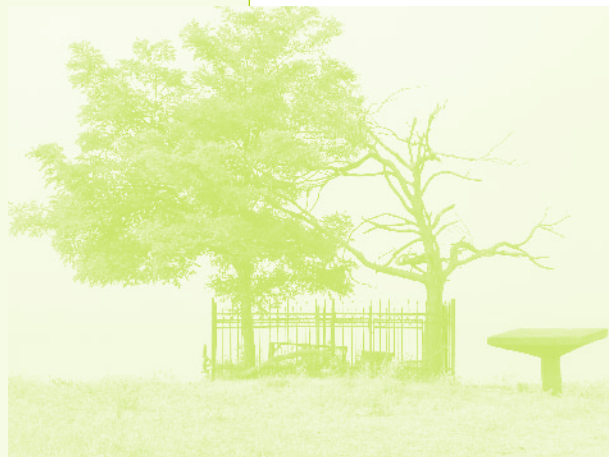
Фото 43. «Святое место, пир оставшееся от прежних жителей села. Село Керкендж, Азербайджан, 2006 г.»