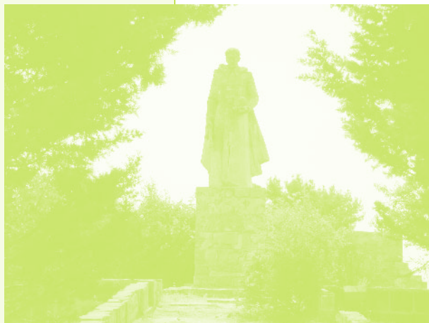
Фото 41. «Памятник воинам-керкенджцам, погибшим во время Великой Отечественной войны. Село Керкендж, Азербайджан, 2006 г.»

объеме было уже невозможно, да и привычные способы хозяйствования склоняли к возврату к животноводству. «Когда сюда переехали, у нас ничего не было из скота. Здесь купили двоих телят, нам две коровы достаточно» (Алы-киши, 72 года).