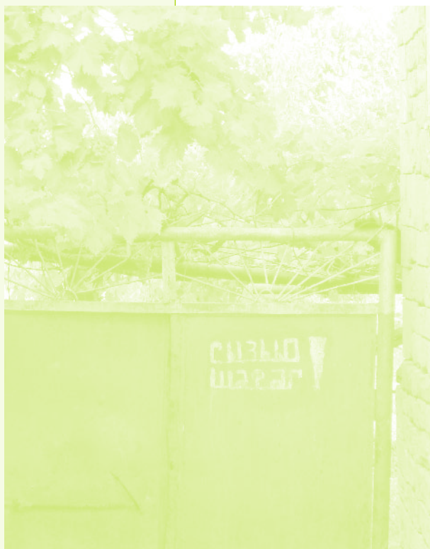
Фото 45. «Надпись на воротах дома в селе Керкендж – «Кызыл-Шафаг». Село Керкендж, Азербайджан, 2006 г.»

ник в ситуации разрыва прежних экономических связей между бывшими советскими республиками оказалось делом почти безнадежным. Ранее из Армении осуществлялись поставки необходимых химикатов для борьбы с вредителями. Когда поставки прекратились, большая часть винограда погибла. «Да, после того как армяне ушли, много виноградников погибло. Так как не могли найти специального лекарства [называют необходимые химикаты – гейдаш, досл. с азерб. – «синий камень» - Авт.]. Это лекарство привозили они (армяне) из Еревана. После армян виноград погиб. А другие ле-