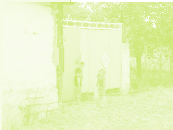
Фото 48. «Обязанностью многих детей стали повседневные походы к источнику за водой. Село Керкендж, Азербайджан, 2006 г.»