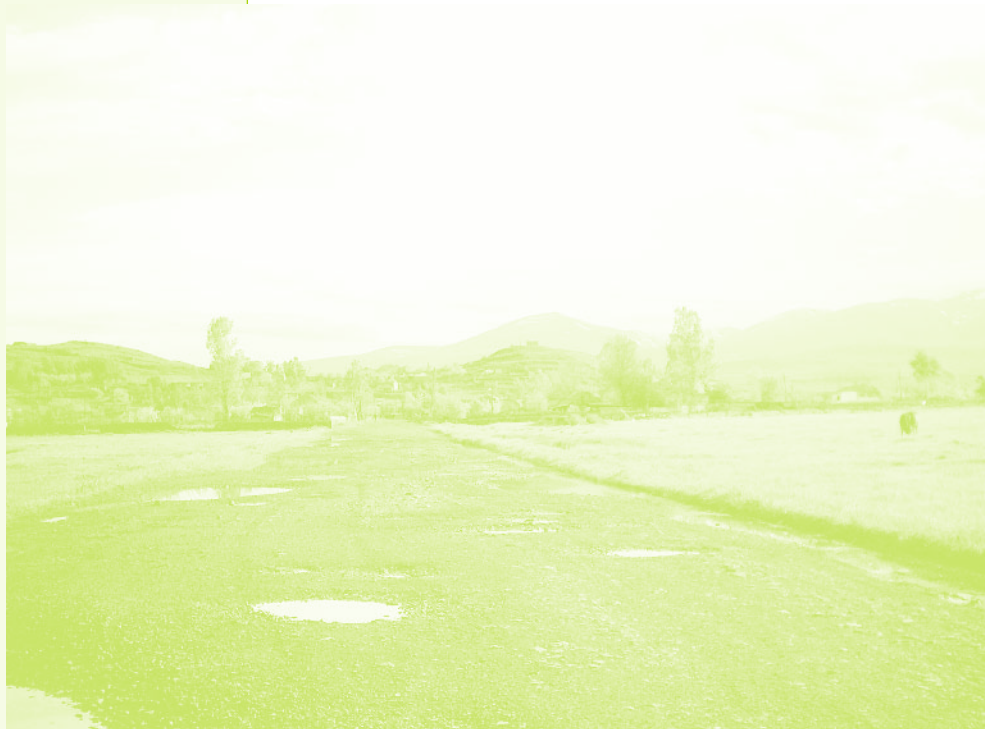
Фото 12. «Село Дзюнашох (Кызыл-Шафаг), Армения, 2006 г.»

поддержать будущих переселенцев, но многие оказались на это просто неспособны.