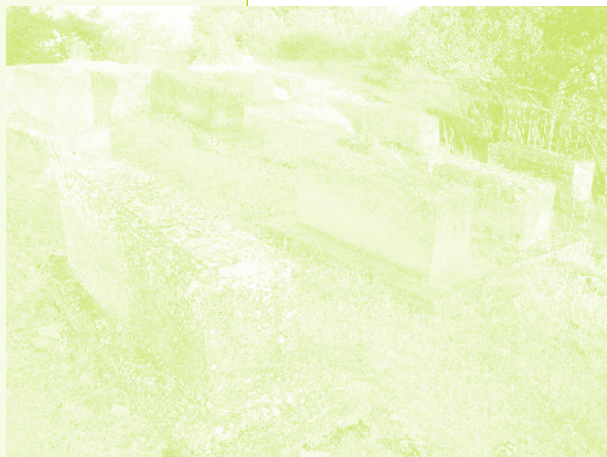
Фото 17. «Армянское кладбище, село Керкендж, Азербайджан, 2006 г.»

менивались с Кызыл-Шафагом именно потому, что те согласились сохранить наше кладбище. В общие рамки договоренности входило и то, чтобы соответствующее государственное имущество без потерь было передано другой стороне. В конце концов, так это и было сделано, и все было оформлено по закону.