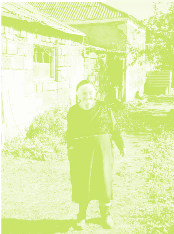
Фото 51. «Женщина из села Керкендж. Дзюнашох (Кызыл-Шафаг), Армения, 2006 г.»