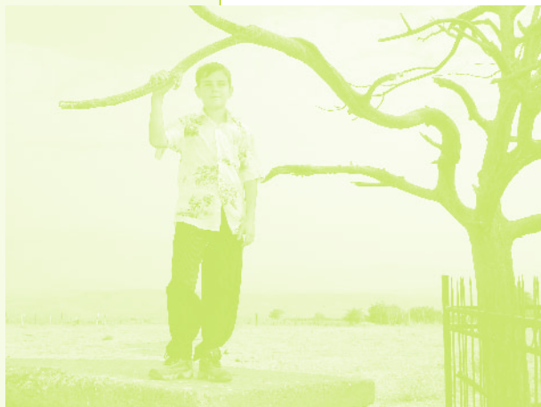
Фото 50. «Новое поколение жителей села Керкендж посещает и старый пир. Село Керкендж, Азербайджан, 2006 г.»

Неизбежность примирения с действительностью, приспособление к новым условиям так или иначе помещены в контекст политической родины. Правильное воспитание homo soveticus предполагало твердую ориентацию на советскую родину. Да, все это была советская земля, но политическое единство не отменяло разнообразия национальных родин. Последовавший распад СССР происходил в ситуации привычных для азербайджанца представлениях о национальном очаге, ведь советский Азербайджан существовал уже долгие годы.