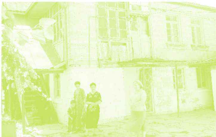
Фото 4. «Молодые женщины и дети пережидали опасные дни в соседнем селе Ирганчай (Грузия). Село Керкендж, Азербайджан, 2006 г.»