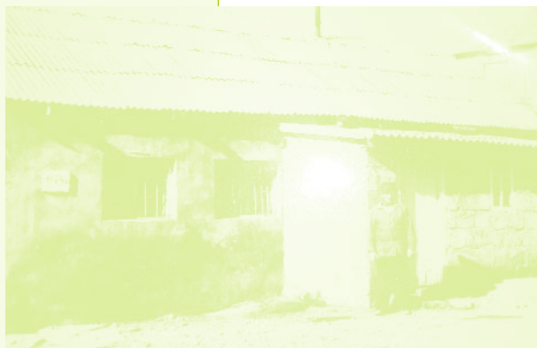
Фото 3. «Фотография Мамедакиши в дни самообороны жителей села Кызыл-Шафаг (Армянская ССР)»

Видимо, ситуация менялась все же быстрее, чем люди успевали ее осмысливать. Однако, у кызыл-шафагцев, к их счастью, был необходимый запас времени на постепенный поиск приемлемого выхода из создавшейся ситуации. Дело в том, что во многом их ситуация определялась удачной близостью села к Грузии. Следует думать, что географическое расположение на границе сыграло заметную роль и