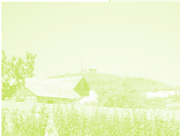
Фото 37. «Банк: часовня Св. Геворга на холме. Село Дзюнашох (Кызыл-Шафаг), Армения, 2006 г.»

50. На имя полковника Заканя, «Аревацаг», 1989, № 127 (на арм. яз.).