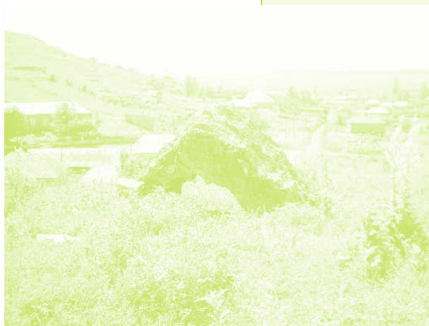
Фото 36. «Святой камень на холме около Ванка. Село Дзюнашох (Кызыл-Шафаг), Армения, 2006 г.»

чалась уже в процессе переселения, когда керкенджцы привезли с собой те вещи и символы, которые были для них значимы. Если посуда и утварь как бы материально характеризовали общность и продолжение традиции, то бюст С. Закяна приобрел важное символическое значение на новом