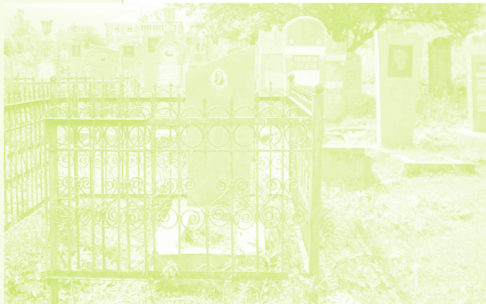
Фото 18. «Азербайджанское кладбище в селе Дзюнашох (Кызыл-Шафаг), Армения, 2006 г.»

якобы ездили по Азербайджану, пока не нашли подходящую деревню. «Почему именно в Керкендж? А вот этот наш Байрам-муаллим, <...> а также несколько человек из деревни ездили из деревни в деревню, искали место (землю) в Азербайджане, хорошую, пустую деревню, для того чтобы переселить наших. После Байрам-муаллима, половина деревни переселилась сюда, а уже потом и я переехал, обстроились и живем сейчас» (Алы-киши, 72 года).