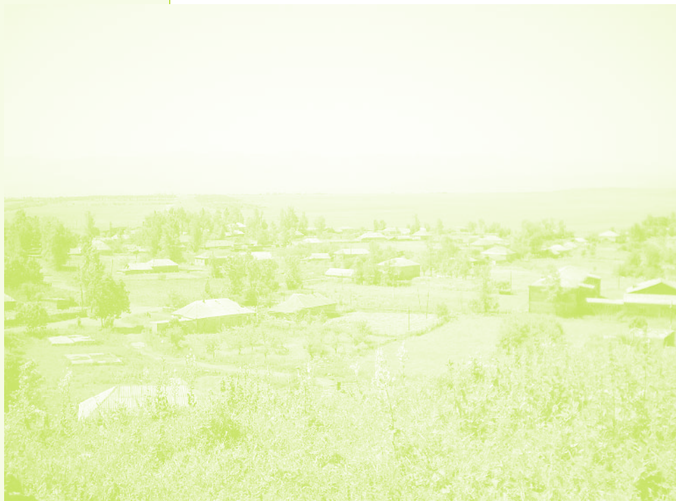
Фото 14. «Село Дзюнашох (Кызыл-Шафаг), Армения, 2006 г.»

жившим в Армении, или, наоборот, что эта идея зародилась у тех керкенджцев, которые жили в Армении. Просто в это время идея казалась такой естественной, что была просто артикулирована и активизировала людей, в том числе живущих в Армении. Последние имели родственников в селе, и им была безразлична не только судьба своих родственников, но и села, общины. И индивидуальный выход из положения требовал общинного решения, а общинное решение подразумевало также индивидуальный выход из положения. Община не подавляла индивидуальность, просто в эти смутные времена было явное различие