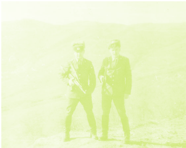
Фото 10. «Солдаты внутренних войск СССР в селе Керкендж»

22. Здесь не имеются в виду Нагорно-Карабахская автономная область и прилегающие к ней армянонаселенный Шаумяновский район и несколько селений Ханларского района.