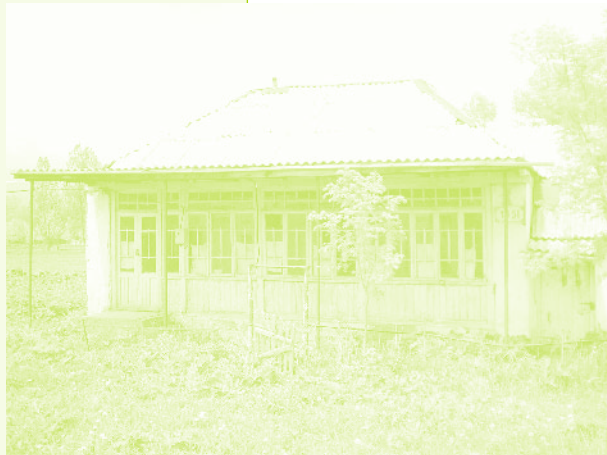
Фото 25. «Дом в селе Дзюнашох (Кызыл-Шафаг), Армения, 2006 г.»

воспоминаниям информантки, позже азербайджанец с семьей и вещами приехал в Керкендж, не предупредив ее заранее. Поэтому она некоторые свои вещи оставила там, потому что в тот момент не была готова к переезду, несмотря на то, что уже шесть месяцев назад она отправила большую часть вещей в Армению к родственникам. «В день, когда я собиралась