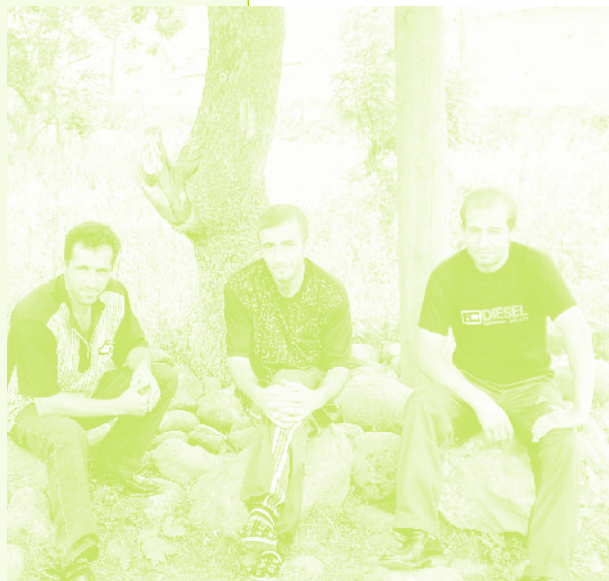
Фото 54. «Жители села Дзюнашох (Кызыл-Шафаг), Армения, 2006 г.»

ся Керкенджу, малой родине, не требует забвения Керкенджа, а, по сути, противопоставляется Азербайджану, т.е. стране, где они жили.